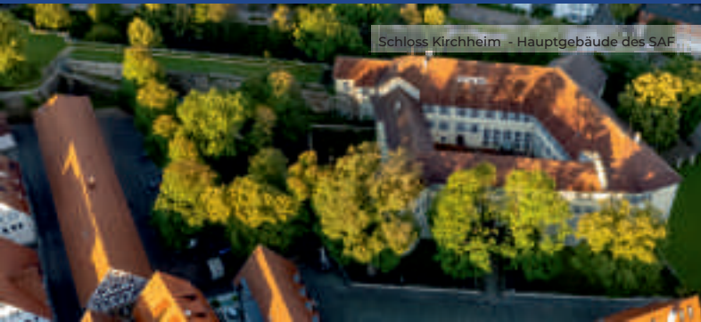
Schloss Kirchheim - Hauptgebäude des SAF

Fachlehrer/Fachlehrerin für musisch-technische Fächer